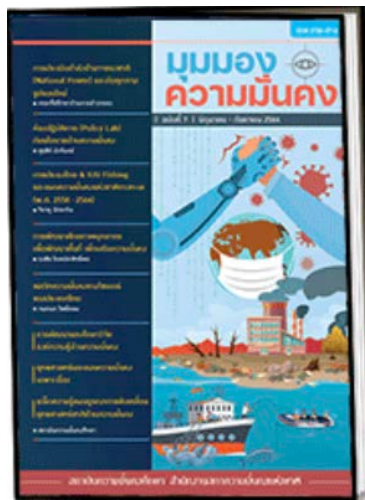
ฉบับที่ 7 มิถุนายน - กันยายน 2564

การจัดทำวารสารมุมมองความมั่นคงราย 4 เดือน เป็นอีกหนึ่งภารกิจภายใต้การดำเนินงานของ สมศ. เพื่อเป็นแหล่งรวบรวมผลงานทางวิชาการด้านความมั่นคง สนับสนุนการใช้ประโยชน์จากผลงานทางวิชาการและสร้างความรู้ ความเข้าใจในด้านความมั่นคง เสริมสร้างเครือข่ายความร่วมมือและประสานงานในการบริหารจัดการข้อมูลวิชาการระหว่างหน่วยงานด้านความมั่นคง และเป็นการแลกเปลี่ยนข้อมูลข่าวสารและเอกสารสิ่งพิมพ์ต่าง ๆ กับหน่วยงาน และเครือข่ายที่เกี่ยวข้อง โดยในห้วงที่ผ่านมาได้จัดทำวารสารมุมมองความมั่นคง ฉบับที่ 7 มิถุนายน - กันยายน 2564