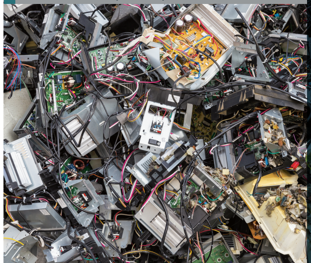
Electronic waste (E-Waste)

ประการสุดท้าย ปัญหาด้านเจ้าหน้าที่ผู้บังคับใช้กฎหมายเอง ความท้าทายในด้านนี้มีมิติที่กว้างขวาง แต่หากพิจารณาโดยตีกรอบของปัญหาลงมา จะเห็นประเด็นสำคัญหลายประเด็น ซึ่งเป็นความท้าทายของรัฐในการแก้ไขปัญหา เช่น เจ้าหน้าที่ผู้บังคับใช้กฎหมายขาดความรู้ความเข้าใจในกฎหมายที่ตนต้องรับผิดชอบ ซึ่งอาจเกิดจากตัวเจ้าหน้าที่เองที่ไม่ใส่ใจในการพัฒนาปรับปรุงตนเองให้ทันสมัยกับกฎหมายในปัจจุบัน หรืออาจเกิดจากระบบที่ไม่เอื้ออำนวยในการสร้างผู้เชี่ยวชาญในกฎหมายด้านนั้นๆ โดยเฉพาะ เช่น เจ้าหน้าที่ที่ต้องโยกย้ายตามวาระ ทำให้ไม่สามารถเข้าใจกฎหมายฉบับนั้นได้ดีพอ หรือการทำงานที่แยกส่วนกันระหว่างหน่วยงาน ไม่มีความเชื่อมั่นระหว่างหน่วยงานทำให้การประสานงานระหว่างหน่วยงาน หรือความร่วมมือระหว่างประเทศ ไม่มีประสิทธิภาพ เป็นต้น